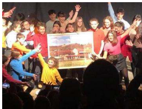
Salon LIRENVAL de Chevreuse en avril 2022