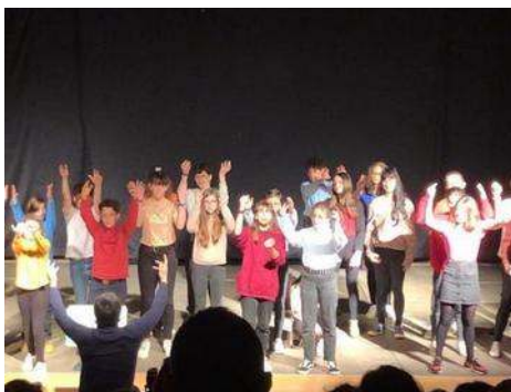
Salon LIRENVAL de Chevreuse en avril 2022