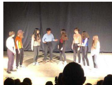
Salon LIRENVAL de Chevreuse en avril 2022

Interviews réalisées par Zoé, 6e4 et Valentine, 6e5